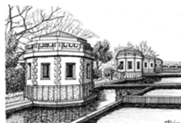
町裏浄水場(姫路市八代) 沢田 伸画