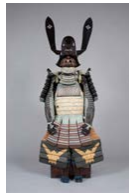
浅葱糸威革包二枚胴具足 ／兵庫県立歴史博物館蔵

問合せ先： 兵庫県立歴史博物館 〒670-0012 兵庫県姫路市本町68 番地 TEL：079-288-9011 FAX：079-288-9013 http://www.hyogo-c.ed.jp/~rekihaku-bo/