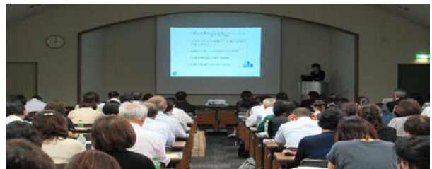
少子対策・子育て支援推進員研修

問合せ先：兵庫県企画県民部女性青少年局男女家庭課 〒650-8567 神戸市中央区下山手通5丁目10-1 電話：078-362-4185