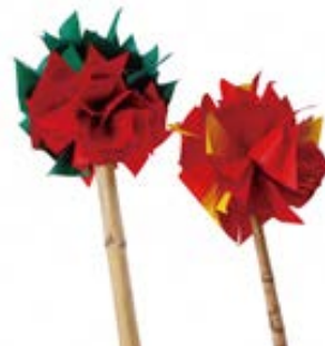
歴はく倶楽部(9月)作品例

問合せ先： 兵庫県立歴史博物館 〒670-0012 兵庫県姫路市本町68番地 TEL : 079-288-9011 FAX : 079-288-9013 http://www.hyogo-c.ed.jp/~rekihaku-bo/