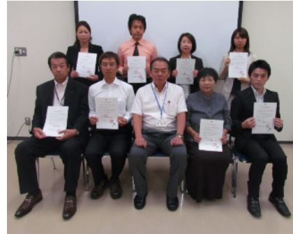
(問) 少子対策課 078-362-3385

式に参加した企業からは、「育休をとる事や子育てに協力出来る事を会社側も進んで努力できればと思いました」といった声が聞かれました。