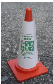
【駐車場での設置例】