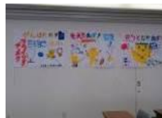
けつだんしき ようす 結団式の様子