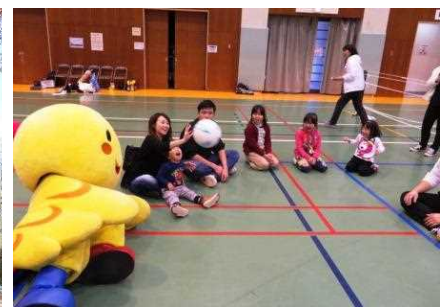
シッティングバレーボール