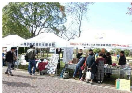
あおぞらいちば 青空市場の様子