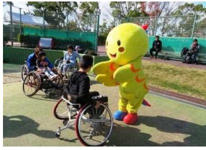
くるま 車いすテニス