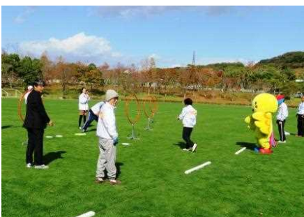
フライングディスク

また、同日、パラ・スポーツ王国 HYOGO&KOBE の会場内において県立特別支援学校高等部の生徒が制作した木工品や小物入れ、クリスマスリースといった手作り作品等を販売する「青空市場」を開催しました。学校で磨いた接客技術を発揮して訪れたお客さんに品物の説明をしたり、道行く人にチラシを配ったりしたことで品物が売れ、自信もつながり、生徒たちの晴れやかな姿が印象的でした。今年度は第1回目の試みで9校の参加となりましたが、天気にも恵まれ、生徒たちによる呼び込みや宣伝の声が聞こえる活気あふれる雰囲気の中、大盛況の「青空市場」となりました。