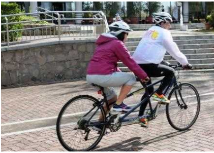
じてんしゃ タンデム自転車