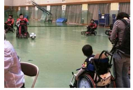
くるまいす 車椅子サッカー