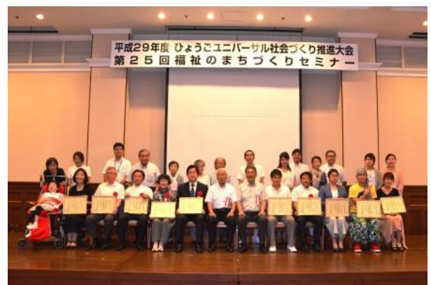
ユニバーサル社会づくり賞贈呈式