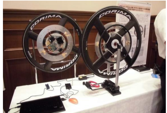
福祉のまちづくり研究所による展示