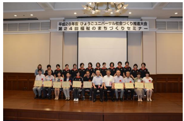
ひょうごユニバーサル社会づくり賞 受賞者の皆さん