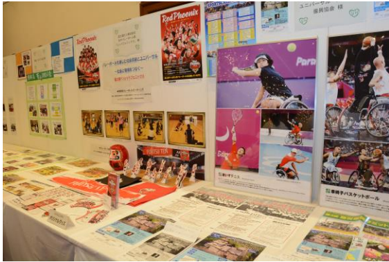
ひょうごユニバーサル社会づくり賞

また、会場には「ひょうごユニバーサル社会づくり賞」の受賞活動や福祉のまちづくり研究所の研究活動の展示も行われ、多くの参加者でにぎわいました。