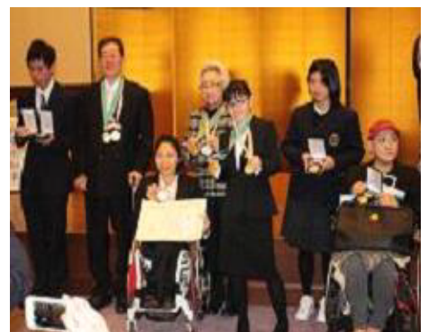
ひょうしやうしき じゅしやうしや 表彰式と受賞者のみなさん