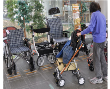
さくねん かいじょう ようす ~ 昨年の会場の様子 ~