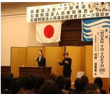
こうえんかい ようす 講演会の様子