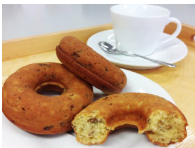
とうふまるごとやきどーなつ (ラムレーズン&プレーン)