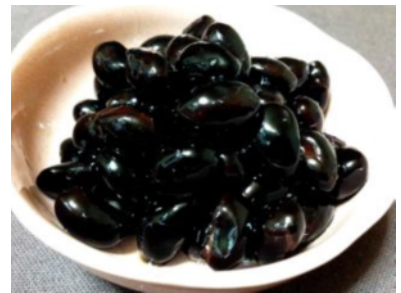
たんばくろまめに 丹波黒豆煮