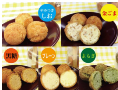
サータアンダギー (5種類から選択)