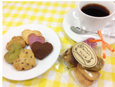
ハートクッキー (130円)