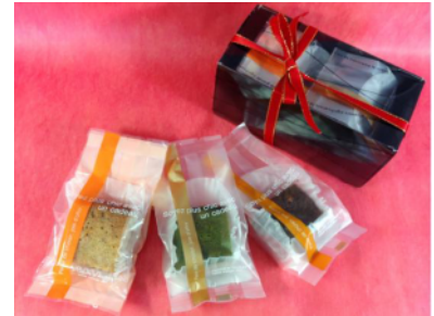
Sazanka Brownie Set 1 (700円)