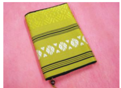
きもの 着物リメイクブックカバー