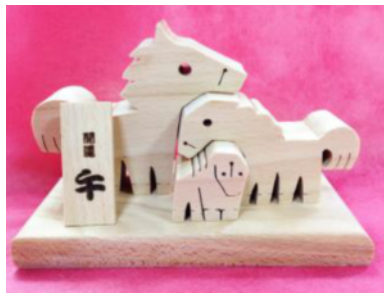
えと おきもの かぞく 干支の置物～家族～