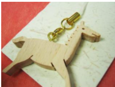
えと 干支ストラップ

+NUKUMORI ( http://www.nukumori-hyogo.com/ )