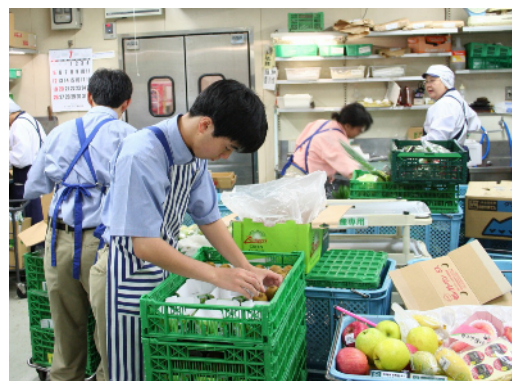
訓練の様子(左:ものづくり科、右:総合実務科)