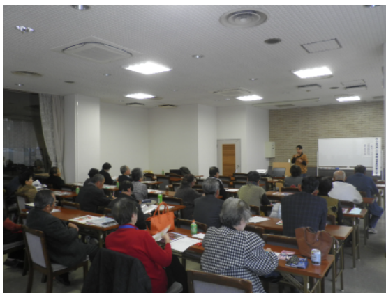
研修交流会の様子(県立姫路労働会館)

今後は1月～2月にかけて下記の地域においても実施する予定です。みなさんは是非お申し込みください。