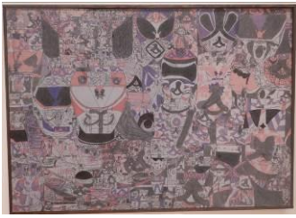
かいが ぶ 【絵画の部】 せんたい とうじよう 「戦隊ゴレンジャー登場」 ふじおか ゆりか (藤岡 侑里圭)