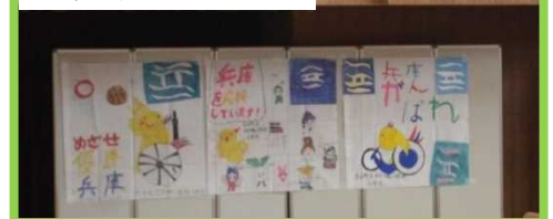
斑鳩小学校メッセージ