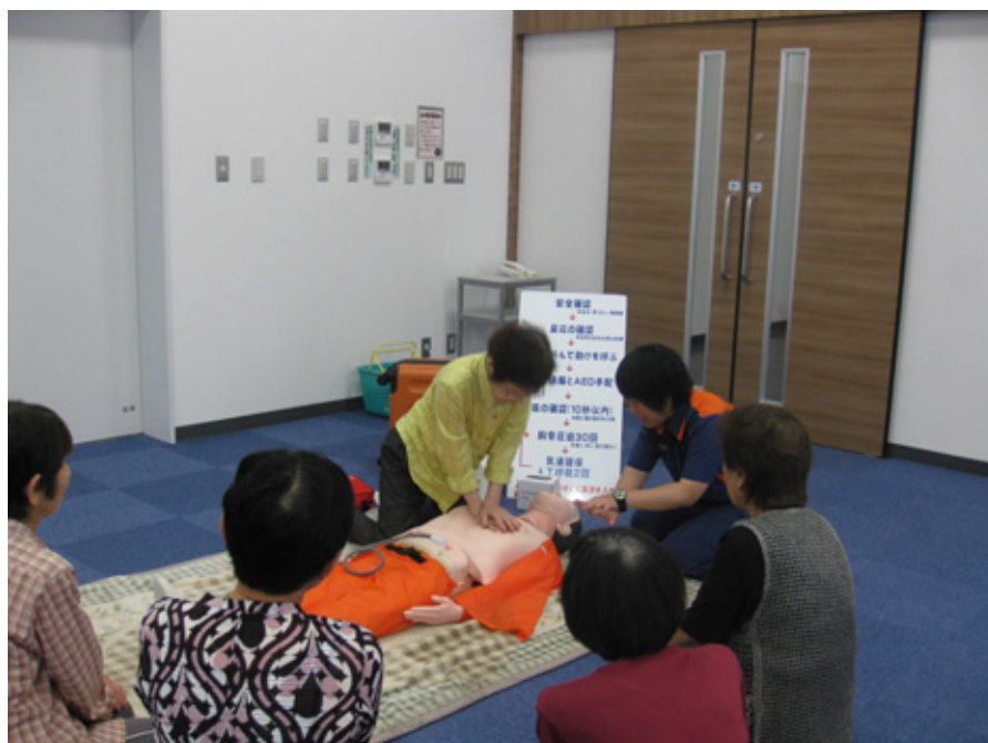
生活支援サポーター（協力会員）の研修会

定期的なミーティングでは、活動中、対応に困った事などを話し合う。例えば協力会員が依頼会員にお茶を勧められる事が増えてきたため、協力会員で話し合った結果、「Myお茶」を持参していくことにした。サポーターは1人で活動するため、協力会員同士で情報交換を行い、個人の活動ではなく介護ファミリーサポートセンターの活動として意識し、常にボランティアとしての心構えを忘れないよう支援している。