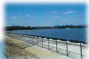
三田カルチャータウン太陽光発電所

ラジコンと同様の操作用モニターが付属しており、カメラ映像を見ながら操縦でき、障害物があっても、衝突回避センサーが装備され、安全に操縦が可能です。