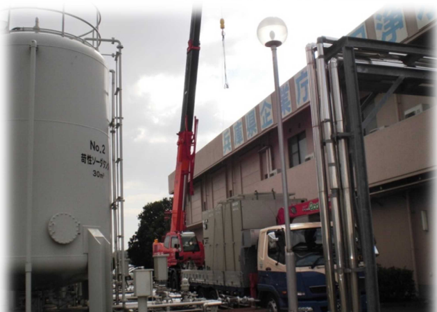
新設備に切り替え後旧設備を撤去しました。

旧受変電設備は稼働させながら、新たに電線管を布設するなどし、新受変電設備を整備し切り替えを行いました。