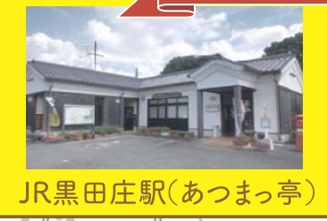
JR黒田庄駅(あつまっ亭)