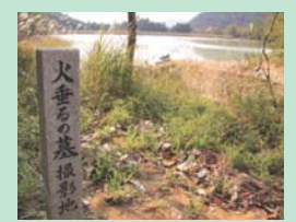
実写映画「火垂るの墓」のロケ地になったため池