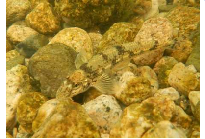
コイ科 カマツカ 3,4,6,7,8号床止工