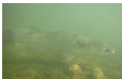
ボラ科 ボラウキゴリ属 1,2号床止工