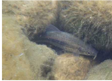
コイ科 タモロコ 1,2,4,6,8号床止工