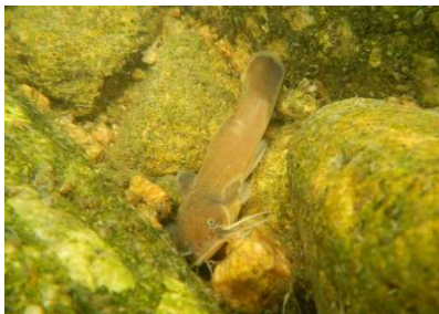
アカザ科 アカザ 7号床止工 (2個体のみ)