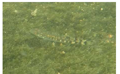
ハゼ科 ウキゴリ属 1,3,4,6号床止工