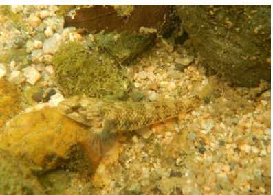
ハゼ科 カワヨシノボリ 2~8号床止工