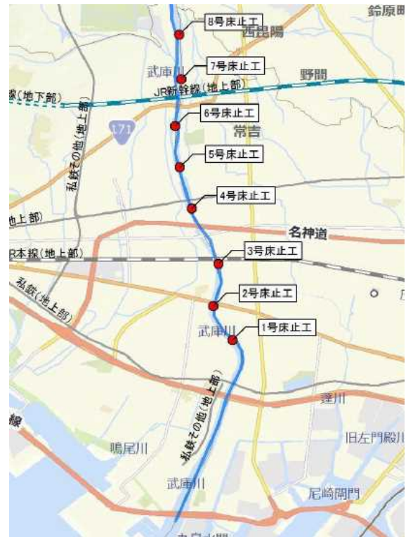
図 1 調査位置図