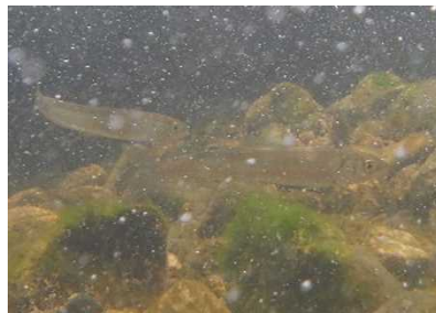
アユ科 アユ 1~8号床止工