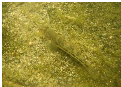
ハゼ科 ゴクラクハゼ 1,4号床止工