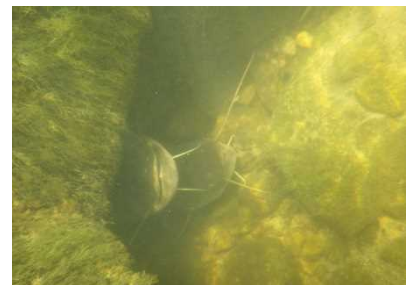
ナマズ科 ナマズ 1,4,5,7,8号床止工