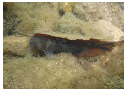
ギギ科 ギギ 1,5,6,7,8号床止工