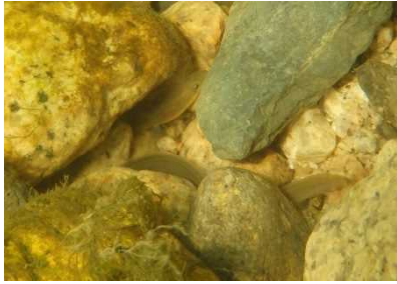
ウナギ科 ニホンウナギ 1号,2号,4号床止工