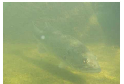
サンフィッシュ科 オオク チバス(特定外来種) 1,6号床止工