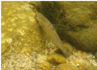
コイ科 スゴモロコ類 3,5,7,8号床止工