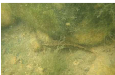
カワアナゴ科 カワアナゴ属 1号床止工(1個体のみ)