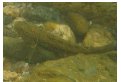
ハゼ科 スマチチブ 1,4,7号床止工