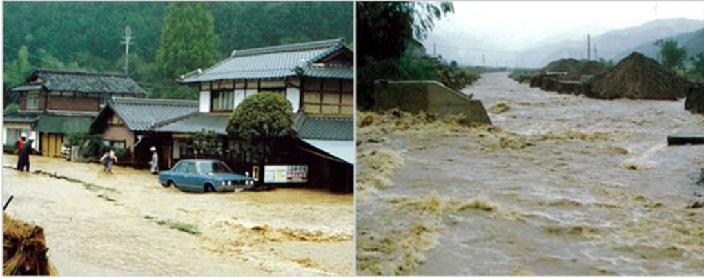
大山川の様子（篠山市[旧丹南町]）

台風は日本の南方洋上を北西に進み、25日に沖縄本島と宮古島の間を通過して東シナ海に入って北上した。27日に進路を東寄りに変えて、28日10時頃に長崎市付近へ上陸した。上陸後は九州を横断して高知県宿毛市付近に再上陸し、15時に温帯低気圧となって南岸を東に進んだ。また、24日頃から西日本に停滞した秋雨前線が台風の接近とともに活動を活発化し、雨もようの日が続いた。特に28日、県内では早朝から強雨が断続し、24日からの総雨量は名塩の346mmを最高に、200mmを超えた所が多かった。雨は低気圧が潮岬付近を通過してようやく止んだが、神戸市付近ではこの頃から北風が強くなり、瞬間風速は30m/sに達した。