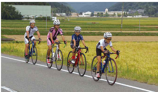
三田・もち処 つくしの里付近