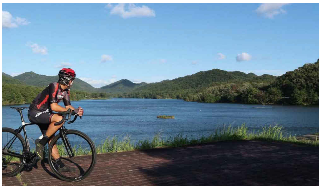
千丈寺湖(青野ダム)