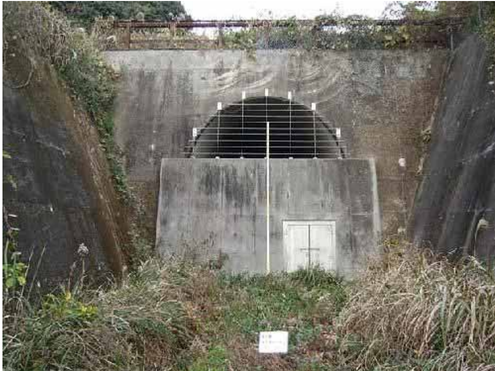
第 3 湊トンネルの坑口。トンネルの長さは約 920m、坑内の高さは最大 5.7m、幅は最大 4.8m。坑口までの距離は国道 204 号から約 600m

譲渡先を募集しているトンネルは、すべて佐賀県唐津市内に位置する。長さ約 1.3km の「第 2 西唐津トンネル」と同 920m の「第 3 湊（みなと）トンネル」、同 280m の「相賀（おうが）トンネル」、同 73m の「鳩川トンネル」の 4 本だ。このうち、鳩川トンネルには、10 月 13 日までに利用の申し込みがあったという。