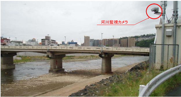
リバーサイド住宅