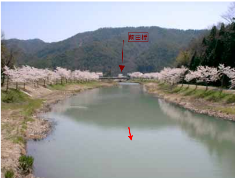
湛水域の状況 (高井橋より上流を望む)