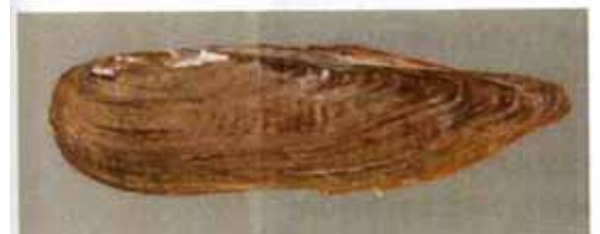
トンガリササノハガイ