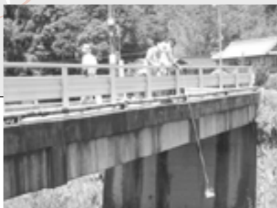
波豆川の西田橋採水作業

このツアーでは、北摂里山街道を走行して日出坂洗いぜき・青野ダム・人と自然の博物館・武庫川上流浄化センター・一庫ダムなどを訪問します。そこでは、専門講師の講座と訪問施設の担当者の説明を計画しています。水グループは、「貴重な水資源と環境」の広報に努力したいと考えます。