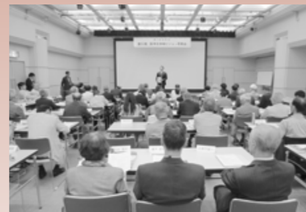
第1回全体会の模様（関連記事2ページ）