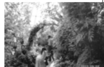
H24.9.5 伊丹市昆虫館研修

11月：「地域見本市」にパネル展示他にて参加。活動の記録をまとめます。 12月：三田市乙原にて専門委員を囲み半期の活動の振り返りをします。