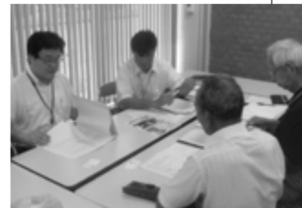
H24.8 伊丹市における調査風景