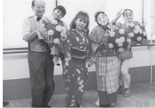
～歌に踊りに腹話術～