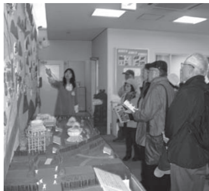
川西市文化財資料館