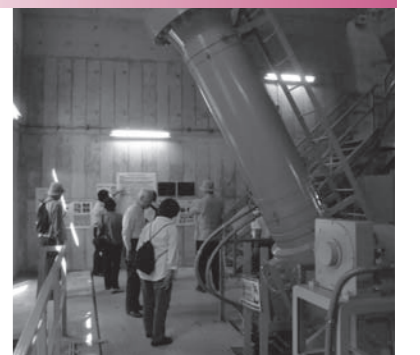
ダム堤のギャラリー

一庫ダムは、猪名川支流一庫大路次川にあり、能勢電鉄山下駅からバスで行きます。貯水池は知明湖といい、真中に県立一庫公園があります。ダムの堤体は、高さ75m、長さ285m、堤内には上中下3本の通路があり、階段やエレベーターで連絡しており、ゲート開閉装置などの設備を収納するギャラリーもあります。一番底の通路は、湖底の岩盤の上であり、ダム湖の水圧で水が染み出して湿度100%に近く、温度は年中15度位です。