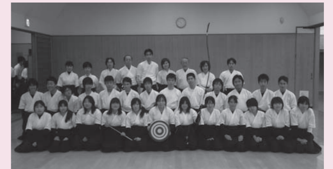
川西弓道場にて、弓道教室受講者、県立川西緑台高校弓道部、県立川西北陵高校弓道部