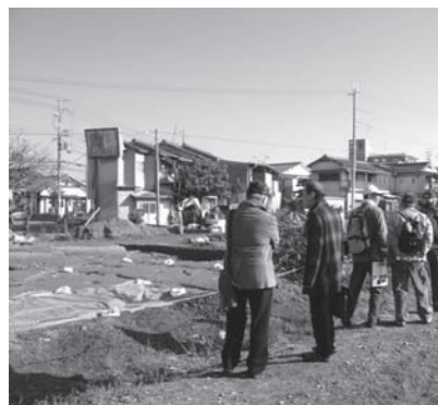
加茂遺跡発掘現場

古代から中世へと、「地域資源を活かした川西のまちづくり」について、現地の方々とも意見交換することができ、有意義な一日となりました。