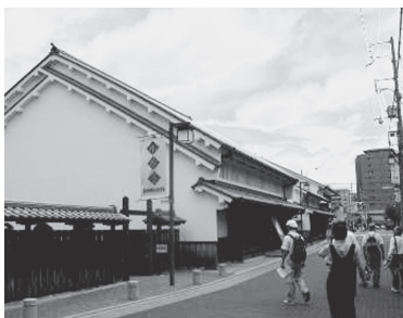
伊丹郷町(旧岡田家住宅)

今回は、7月に行われた伊丹地区『有岡城跡から昆陽寺行基堂までの西国街道』散策の様子をレポートしていただきます。