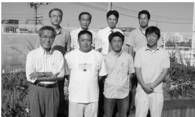
※QRコード=いろいろな情報を入力してある2次元コード

次代を担う子供たち、若者たちが地球環境の大切さを知るためには、自然・緑に近づくことが一番です。そこで最近の若者たちのデジタル思考のシンボルである携帯電話を使って、公園などの樹木銘板の代わりに樹木名などをインプットしたQRコードを貼り、瞬時に樹木の名前、特徴などが分かるシステムを確立したいと思います。