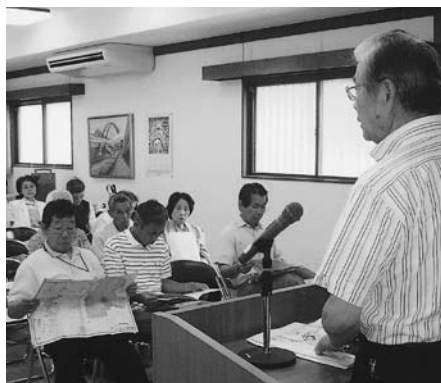
▲猪名川町ふるさと館にて

昨年、町制施行五十周年を迎え、全国川サミットを開催し、これを期に流域市町が一体となって、ホテルが乱舞する清流猪名川を取り戻すためホテルの生息調査をはじめ「豊かな自然を守る森林環境」「資源を活用する生活環境」「親しめる河川環境」