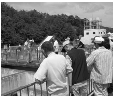
▲多田浄水場を見学

今回の猪名川流域エコバスは猪名川のいとなみと水についてより多角的に勉強できたエコツアーとなり参加者一同納得、有意義な一日でした。（水グループ 大下 章）