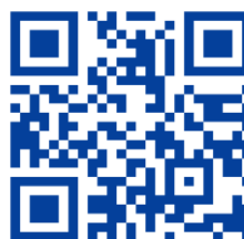
兵庫県版 見える化ページ