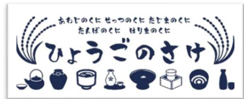
「特製手ぬぐい」のデザイン

さらに、専用応募ハガキでアンケートにお答えい ただきご応募いただければ、抽選で140名に、蔵元から直送で「プレミアム清酒」をプレゼント。