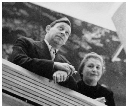
アイノ・アアルトとアルヴァ・アアルト ニューヨーク万国博覧会・フィンランド館にて 1939年