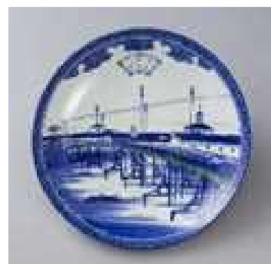
佐賀 有田 《釉下彩大阪鉄橋図大皿》 明治時代 兵庫陶芸美術館（赤木清士コレクション）