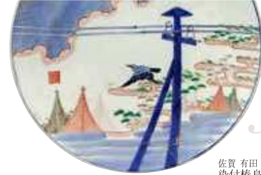
佐賀 有田(瀬戸口富右衛門) 色絵電線図大皿 明治時代(19世紀後半～20世紀初頭)