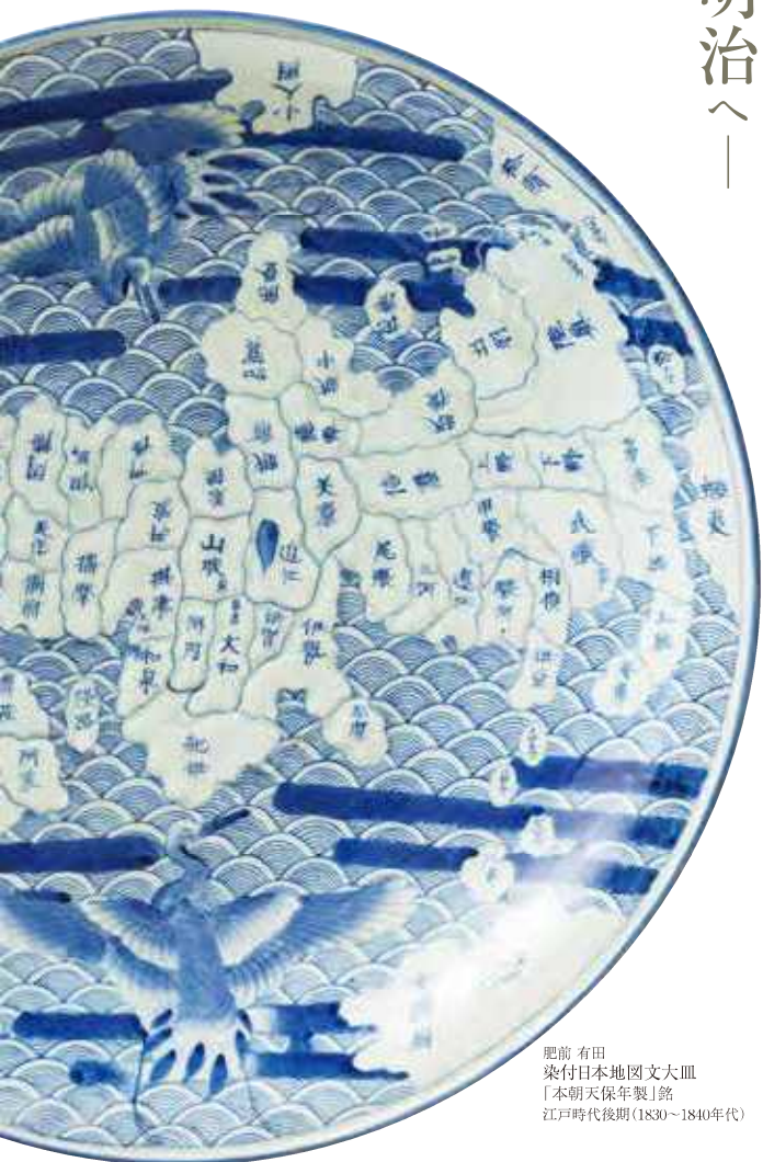
肥前 有田 染付日本地図文大皿 「本朝天保年製」銘 江戸時代後期(1830~1840年代)