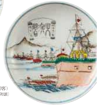
岐阜 美濃 色絵大演習園小皿 明治30年代前半(1897～1902年頃)