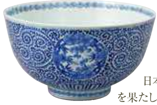
肥前 有田 染付松竹梅唐草文鉢 江戸時代中期～後期(18世紀中頃～末)

日本における磁器生産に大きな役割を果たしたのが、肥前有田(佐賀県)です。17世紀初頭、この地で日本初の磁器が作られました。肥前で作られた磁器は、積み出し港の名にちなんで、伊万里焼と呼ばれました。