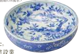
佐賀 有田 染付椿鳥文大鉢 明治時代～昭和時代(19世紀末～20世紀前半) <前期のみ展示>

文明開化による暮らしの変化をいち早く取り入れたものや、富国強兵政策を印象付けるものも作られました。