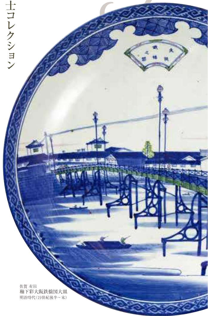
佐賀 有田 袖下彩大阪鉄橋図大皿 明治時代(19世紀後半~末)