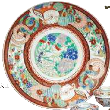
佐賀 有田(深川製磁) 色絵唐花文大皿 明治時代～昭和時代 (20世紀前半)