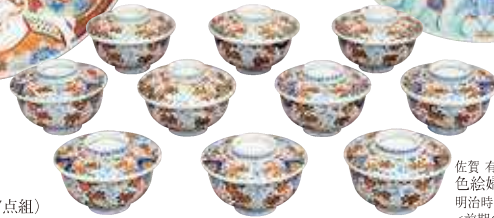
佐賀 有田 色絵婦人草花文蓋付碗(10客) 明治時代(19世紀後半～20世紀初頭) <前期のみ展示>