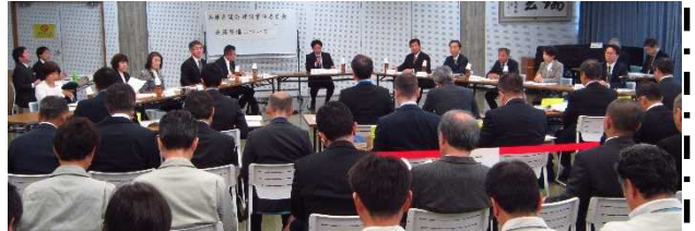
過去の地域開催の様子

今回は、西播磨地域で開催する「健康福祉常任委員会」、淡路地域で開催する「農政環境常任委員会」の傍聴を募集します。