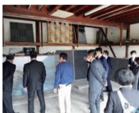
淡路瓦窯元3社連携 プロジェクト (南あわじ市)

地域産業・商業の活性化、雇用の創出、職業能力の向上、国際交流、観光振興などについて調査や議案の審査を行います。長期化するコロナ禍や原油価格・物価高騰、急激な円安等による厳しい情勢の中、事業の継続や雇用の維持、地域経済の活性化に向け、支援策の充実などに取り組めます。