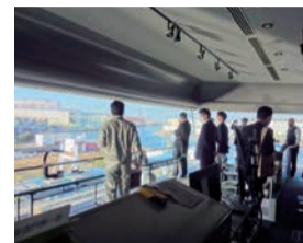
尼ロック 集中コントロールセンター (尼崎市)

近年増加する自然災害に備えた県土づくり、交通インフラや市街地整備のほか、空き家対策など活力あるまちづくりといった、暮らしに直結する重要な取り組みについて審査・調査を行います。今年度は特に、地域創生の実現に向けた地域の活力を生み出すまちづくりについて調査・研究を行っています。