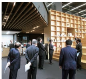
芸術文化観光専門職大学 (豊岡市)

地域の連携、県民の生活の向上や芸術文化の振興、県政改革や防災・危機管理対策など幅広い分野の政策について、審査・調査を行います。県政における課題抽出や、今後の状況変化に応じた施策の展開など、ポストコロナ社会を見据えながら、調査・提言を行っています。