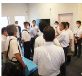
尼崎子ども家庭センター (尼崎市)

安全安心な健康福祉社会の実現に向け、保健・医療・福祉など、皆さんの生活に身近なテーマについて審査・調査を行います。ウィズコロナを踏まえた高齢者施策をはじめ、障害者福祉の推進や子育て支援の充実、医療確保と健康づくりなどについての調査・提言を行っています。