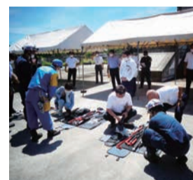
近畿管区機動隊大隊訓練 (三木市)

ストーカー・DV、児童虐待、特殊詐欺などの犯罪防止のほか、暴力団対策やサイバーセキュリティ対策、交通安全や大規模災害対応などの県民の生活を守る警察の取り組みについて、調査、提言を行います。これら多岐にわたる警察活動の充実・強化を図り、安全・安心に暮らせるよう取り組みます。