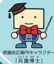
県議会広報PRキャラクター 「兵議博士」