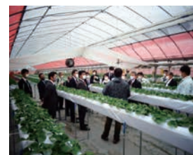
若手農業者等による 地域活性化への取組 「佐用農業生産組合」 (佐用町)

食料の安定供給と農林水産業の振興、これを支える地域の活性化をはじめ、温暖化対策や自然環境の保全・再生などについて、審査・調査を行います。コロナ禍の課題を踏まえ、国内回帰を意識した農林水産業の持続的発展や、地域環境への負荷低減と地球環境問題への対応など、持続可能な社会の実現をめざします。