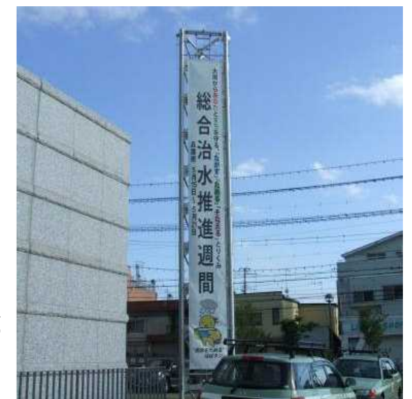
懸垂幕の掲示(兵庫県加古川総合庁舎) 総合治水推進週間(5/15~5/21)