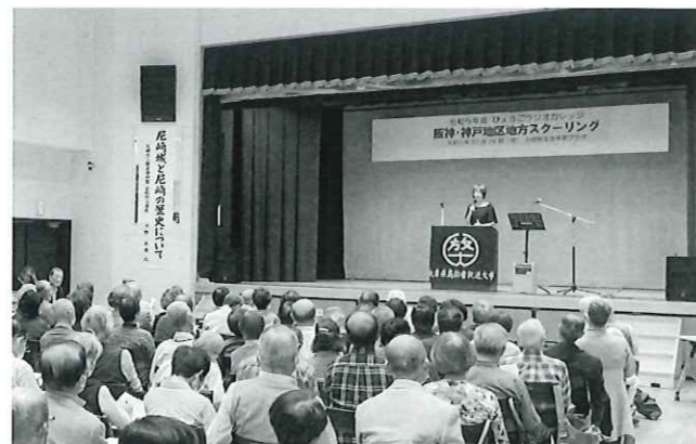
地方スクーリングの様子