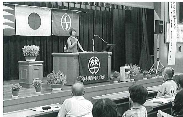
中央スクーリングでの講義