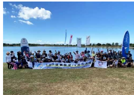
ため池ミュージアム SDGs リレーイベント