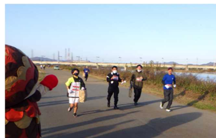
プロギング（みなもロード）

県民への SDGs の啓発及び資源循環型社会の意識醸成を図るため、「みなもロード」をジョギングしながら清掃するプロギングイベントを実施する。