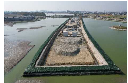
天満大池バイパスの整備

東播磨道（加古川市）の整備、国道2号（明石市、加古川市）の4車線拡幅、県道宗佐土山線（稲美町）のバイパス整備を行うとともに、国・市町と連携し、播磨臨海地域道路の都市計画・環境影響評価手続を進める。