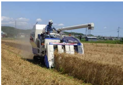
東播磨産デュラム小麦の収穫風景