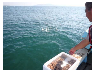
二枚貝の放流（明石市地先）

SDGsの達成目標でもある「豊かで美しいひょうごの海」の創出と継承のため、マダコ産卵用たこつぼの設置や漁場の環境改善につながる二枚貝の移植など、資源管理や漁場の保全等漁業者が水産資源の増大を図る取組を支援する。