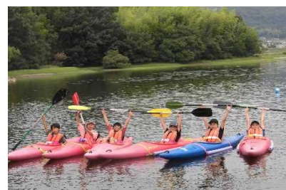
原大池カヌー大会

これまでの取組から芽生えてきた様々な活動やネットワークを生かし、Z世代参画のイベントやため池巡りロゲイニングなどの「ため池ミュージアムSDGsリレーイベント」の取組を実施する。