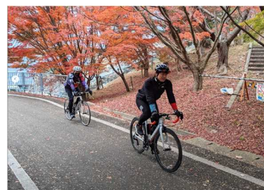
県道 加古川右岸自転車道

SNSの活用や「東はりま・北はりまサイクリングマップ」の配布による情報発信により自転車の利活用を推進する。