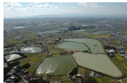
いなみ野ため池群

「ひょうごフィールドパビリオン」として多くの来訪者が見て、学び、体験できるよう、東播磨を象徴する“ため池のある水辺空間”に、公民学連携によりデジタル&フィールドサインを整備する。