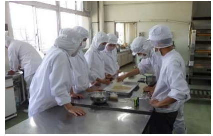
高校生との新商品開発風景

西日本有数の生産規模を誇る東播磨特産の大麦(シュンライ)について、生産者への意識醸成や情報共有、技術指導等を実施するとともに、麦茶だけでなく多様な仕向けによる販路の多角化や、県立農業高等学校と共同で、新商品開発や魅力発信を行い、さらなる生産拡大へつなげる。