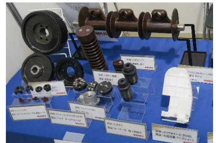
国際フロンティア産業メッセへの出展

ものづくり産業の活性化を推進するため、管内中小企業が国際フロンティア産業メッセへ参加する際の支援や、スタートアップ企業が販路拡大するための支援を行うとともに、合同企業説明会の開催等を通じて管内中小企業の魅力を広く発信する。