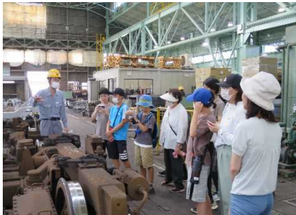
東はりまの魅力 KIDS 体験ツアー