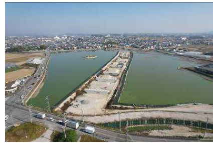
天満大池バイパスの整備