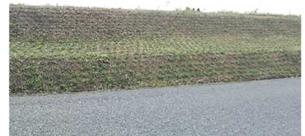
グラウンドカバープランツによる法面被覆 （稲美町長法池）

ため池の防災・減災対策の基本となる「管理者による適切な保全管理」の促進に向けて、大きな負担となっている法面の草刈り作業を省力化するため、グラウンドカバープランツによる被覆工法の導入実証を行う。