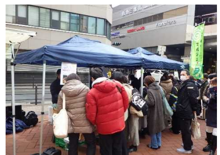
東播磨 Farmers (マルシェ)

地産地消や6次産業を推進するため、都市部でのマルシェの出店支援等に加え、パーボンづくりによる地域循環型農業をめざす取組に対する支援を行うことにより、ブランド力を高め持続可能な農業の取組を展開する。