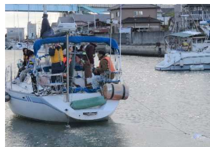
セーリング環境学習教室

持続可能な循環型社会の実現に向け、小学生を対象に、播磨灘に浮かぶプラスチックごみを拾う清掃活動やプラスチック資源に関する講座などを実施する。