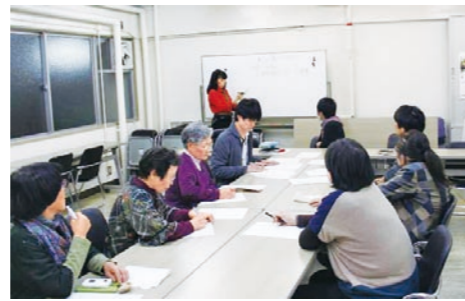
350件以上のアンケート結果を集計・分析

『希望』とは将来の明るい見通しを指して用いること。この言葉をもとに、公平に希望を持てるためにはどのような環境や施設が必要なのかを学ぶために、民間更生施設をはじめ、さまざまな施設見学をおこなった一年目。