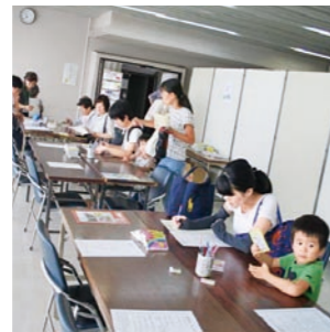
地域活動交流メッセでアンケートを実施

提案書を県に提出し、明るい未来を見据えた平成26年は啓発のイベントを展開し、ドイツの詩人フリードリヒ・シラーの言葉『太陽が輝く限り、希望もまた輝く』のように部会も輝き続けていけるように次年度にバトンを渡したいと思います。