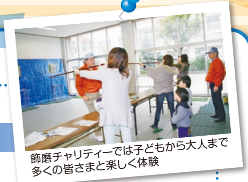
飾磨チャリティーでは子どもから大人まで多くの皆さまと楽しく体験

やれば「楽しい」の言葉が必ず返ってきます。つぎの第7回飾磨チャリティー出展でも181名となり盛況でした。さらに多くの人に「吹き矢」を体験してもらいたいと思います。