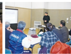
佐用町講師による防災研修会