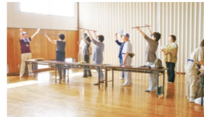
地域活動交流メッセ「吹き矢ブース」大盛況!

前年のふれあいフェスティバルの経験を生かし9月14日(土)10時~15時に福崎町エルデホール前の体育館内に於て「吹き矢」を出展、103名の参加を得ました。