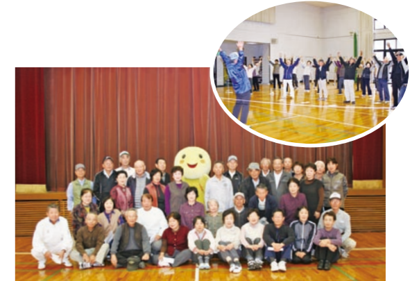
船津ふれあいの館でははばタンと一緒に体力測定

此の様に少しずつ校区の皆様との交流にもより和やかな楽しいひと時を共有できる為の努力を続けたいと思っています。