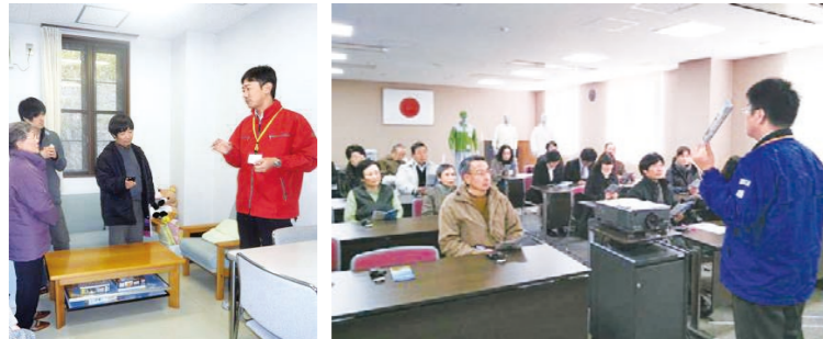
現状や課題を知るために24年度にはさまざまな施設を見学・勉強

県民アンケートをおこない、アンケートから県民がどのような意識を持っているのかを分析し提案書を作成する方向性に変えました。