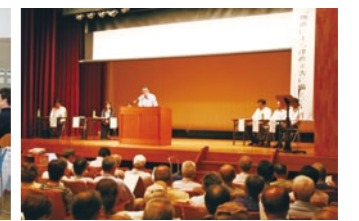
地域の防災講習会への参加