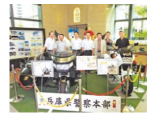
兵庫県警察本部で防災・防犯活動研修会

地域との連携、取り組み状況等を各学校にフィードバックすることにより学校の防災に少しでも参考になればと思います。