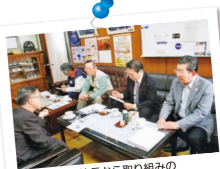
飾磨小学校校長から取り組みの説明を伺う

「人々が助け合って安心して暮らせる地域づくり」を活動趣旨に1年目は、防災施設、拠点の見学会、防災についての研修会を実施し、2年目はテーマを「小学校の防災」に絞り、各学校の防災に対する現状と地域との連携状況について考察することになりました。