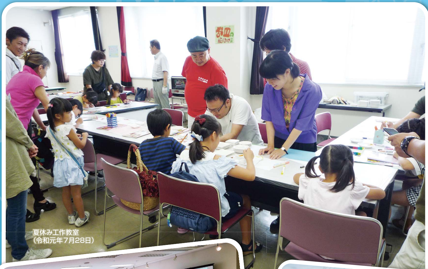
夏休み工作教室 (令和元年7月28日)