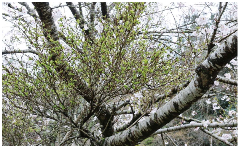
花が咲かずに新芽だけが伸びるてんぐ巢病

私たちが日常見る最も身近な桜がソメイヨシノで、日本全土の約80%の桜がこの桜といわれています。ソメイヨシノの特徴として、葉が出る前にパツと咲いて散る様は一夜の夢のようです。その咲き方や散り方が古来より日本人の生き方になぞらえて大変好まれ、日本全国に植栽されてきました。このようにソメイヨシノは私たちにとって最も身近な桜ですが、寿命の短い樹木ともいわれてきました。その理由としては結実しても発芽に至ることがなく、接ぎ木で苗木を作るからです。つまりソメイヨシノは同じ遺伝子を持ったクローンなので個性が無く、一斉に咲く代わりに同じ病気(てんぐ巢病)にかかりやすく次々と伝染します。そのうえ、ソメイヨシノは隣の樹を別の樹と認識出来にくいので隣の樹の枝と交差する性質を持っています。従って密植にも関わらず、お互いの樹が勢い良く成長を続けて日照不足になります。その結果、樹勢が弱くなり枝枯れが始まるのです。このように問題の多いソメイヨシノを延命治療するのか、新しい桜の種族に交代させるかが大きな課題になっています。