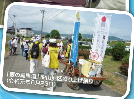
「銀の馬車道」船山地区盛り上げ祭り (令和元年6月23日)