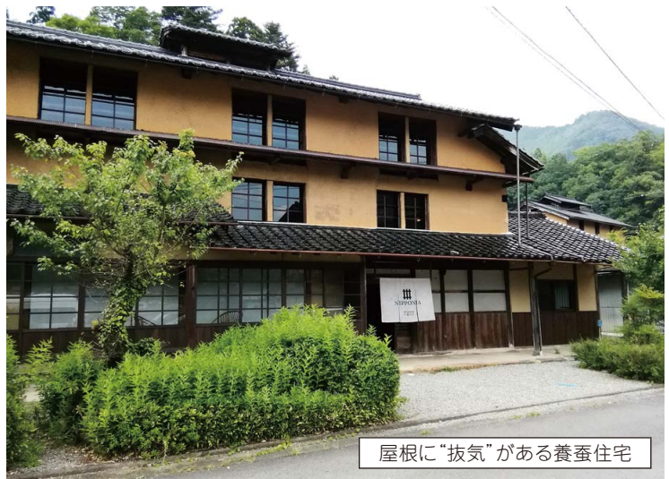
屋根に“抜気”がある養蚕住宅

今も但馬に当時の面影を残している地区がある。養父市大屋町大杉地区の「伝統的建造物保存地区」がそれである。銀の馬車道は生野までとされているが、その先の明延一大屋地区は、銀の馬車道は(生糸の道)としてフランスと、細いけれども確かな赤い糸で結ばれていた。三階建ての養蚕住宅を見ながら思いをはせたことである。