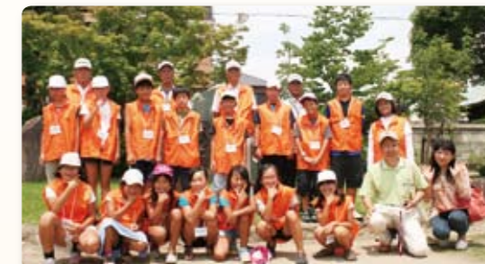
御国野小学校5,6年生が ボランティアガイドとして活躍中

この御着城跡を拠点に活動しているのが、御国野小学生ボランティアガイド。昨秋、ドラマの放映決定を機に、地域の魅力を PR しようと御国野地区文化保存会が呼びかけ、結成されました。現在は小学 5、6 年生 24 人が参加。毎週土、日曜日に御着城跡周辺の歴史スポットを案内するガイドとして活躍しています。6 年生の児童の一人は「地域の歴史を知っておきたかった」と話してくれました。