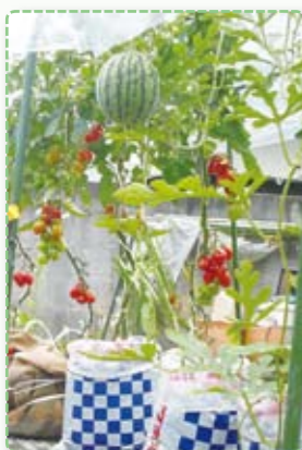
袋栽培実証試験中

農を専業とするには、農地の集積を図り規模拡大し、経営を効率化することが必須です。そのためには企業参入の障壁を取り除く、いわゆる規制緩和が必要です。効率化できない里山に繋がっている棚田、谷あいの農地は耕作放棄地と化し、獣害による人的・物的被害を引き起こしています。私たちは、これらを少しでも減らすことを目指し、研修や実践的活動をしておられる方の講話を聴き、進取の気概のある人達の工夫や努力の姿を学んできました。