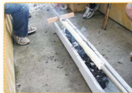
1.5mのちくわを炭火焼き

今後の活動としては中播磨地域で採れる山の幸や海の幸、また住んでいる人しか知らないような郷土料理などをもっと発掘して、より多くの人に中播磨の魅力を発信していきたいと思っています。