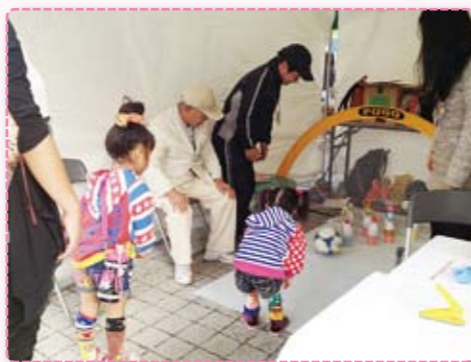
サッカーボウリング