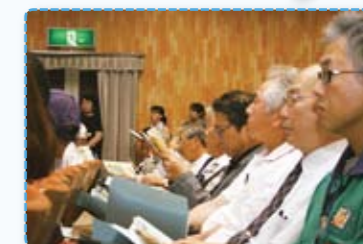
地域の防災講習会に参加

私たちのグループは「人々が助け合って安心して暮らせる地域づくり」を趣旨に活動をしています。平成24年度は防災施設、拠点の見学や防災についての研修会を実施しました。そして地域との連携状況、直面する課題についてグループで話し合いを重ねた結果防災に関して「地域と学校の連携について」をテーマに取り組むこととしました。平成25年度は5月に中播磨地域の各小学校に「防災に関するアンケート」を実施し、おかげさまで74校の回答をいただきました。