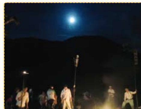
実盛人形を燃やす様子

過疎化は当地域でも例外なく進んでいますが子ども達にふるさとのよさを伝えるために集落一丸となって懸命に取り組んでおられる姿に深く感銘を受けました。