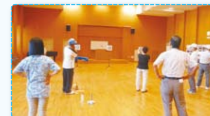
スポーツ吹き矢体験