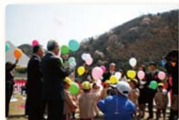
砥堀幼稚園の子どもたちが バルーンリリース