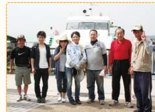
家島町坊勢でちくわを試作

私たち元気交流中播磨部会食グループでは、食で中播磨地域を元気にしようということで、大学生や青年会議所のメンバーも交えた若さあふれるメンバーで活動を行っています。姫路周辺の酒蔵を見学するツアーを行ったり、6月には家島で、ちくわづくりを行ったりしました。家島在住のビジョン委員の方々の協力も