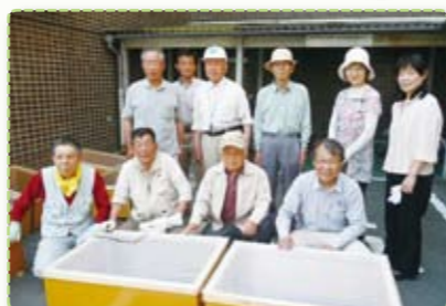
ばいお君コンポストの取扱い説明会

食の地産地消では、虫や臭いのないサラサラのたい肥が出来るコンポストを開発。実証実験を行ったものを、「ばいお君コンポスト」としてモニターを募集し、25名の方に体験してもらっています。