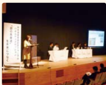
地域資源の活用が議論された