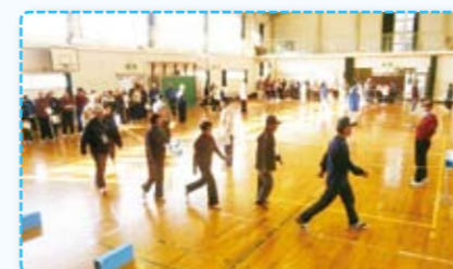
24年に行った勝原小体育館での「6分間歩行」の様様

今年も秋以降に開催すべく、ただいま案内状等を差上げております。新たに実施をご希望の老人会等がございましたら事務局へご一報下さい。