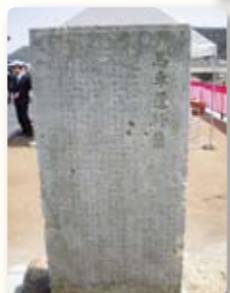
移設保存された修築の碑

最初の記念行事として、銀の馬車道修築の碑ミニパークの竣工式が姫路市砥堀の生野橋西詰めで開催されました。記念碑の除幕式が行われ、砥堀幼稚園の子どもたちがバルーンリリースし、完成を祝いました。ミニパークは明治9年に建てられた、馬車道完成の記念碑を保存。説明看板や花壇なども設置し、新たな交流拠点として整備されています。