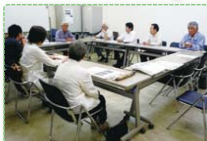
里山実践活動家による実体験講話

これからは農業従事者だけでなく、一般市民の趣味的利用の参加・拡大を図り、耕作放棄地を活用しやすい仕組みとし、土のいらぬ袋栽培を9月の交流メッセに展示し、誰でも楽しめる農をキャッチフレーズに、農を身近なものにできることをPRしたいと思っています。