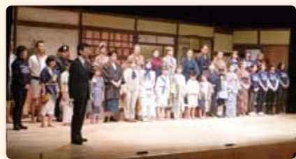
地域住民が熱演した「銀の馬車道」