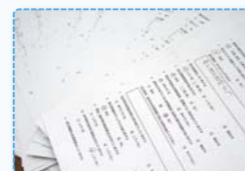
防災に関するアンケート

今後アンケート調査の内容を整理して、現状の把握、分析、考察を行って報告書を作成し、各方面に効果的な方法でフィードバックができればと考えています。その他の活動としては学校と地域との連携の状況や課題について、先進的な取り組みをしている地域や、ユニークな取り組みをしている地域を訪問学習し、また関連して研修会の開催や必要に応じて学校訪問を行って、各委員間の理解を深めながら活動していきたいと思っております。