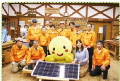
ソーラー発電がひょうごワイワイで放映

交流メッセでは、緑のカーテンであり、美しい優雅な花をつけるケーブタウンブルー（宿根アサガオ）を生ごみ堆肥で育て展示します。ソーラー発電で、音楽を流しながら、パネルの点灯とシャボン玉を飛ばして楽しみ、昨年大人気だった間伐材を使った木工工作を実施します。