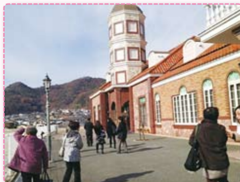
障がい福祉サービス事業所ひかり館見学

見学会を通して、地域には生きづらさを感じながらも懸命に生活している人々がいることを再認識しました。見学させて頂いた施設には、そういった人々を支える仕組みがあることを知り、そして、どの施設においても認知度の低さが課題となっていることがわかりました。そこで、私たちにできることは、正しい情報をできるだけ多くの人々に伝えることだと考えました。