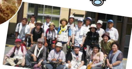
最後は皆で集合写真