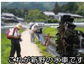
これが新野の水車です