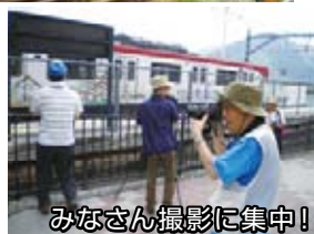
みなさん撮影に集中！