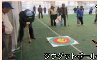
ツウゲットボール