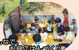
みんなで、お昼ごはんづくり

※参加者随時募集しておりますので、ご希望の方は県民局ビジョン課までご連絡ください。