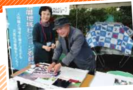
▲交流メッセで写真を展示