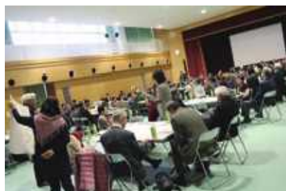
参加者全員で「地域の宝」について意見を出し合いました