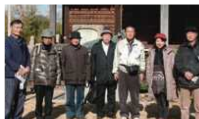
▲牛堂山国分寺にて