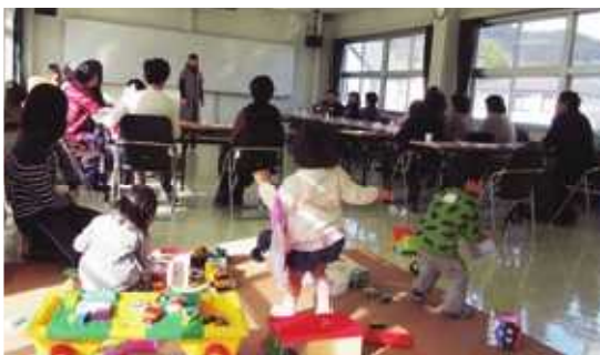
「子育て井戸端会議」には子育て世代だけでなく孫育て中の皆さまにもご参加いただきました

イベント会場などでアンケートを実施し、子育て中の方65名に回答して頂きました。12月に実施した「子育て井戸端会議」では、子育て支援活動をしている方、子育て中の方、地域活動をしている方など、合わせて23名が参加し、貴重な意見交換の機会をつくることができました。様々な世代の方の話が聞けたことがよかったという感想が多くあり、情報共有には直接話をする井戸端会議のような場が効果的であることがわかりました。