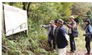
▲生野峠で銀の馬車道の説明を受ける