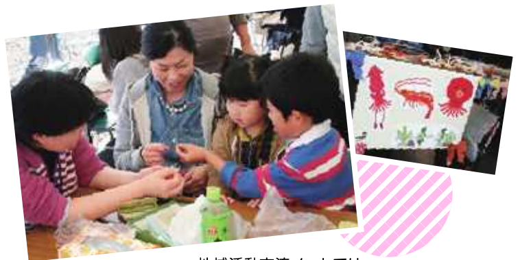
地域活動交流メッセでは ストロー工作と大型絵本のブースを出展