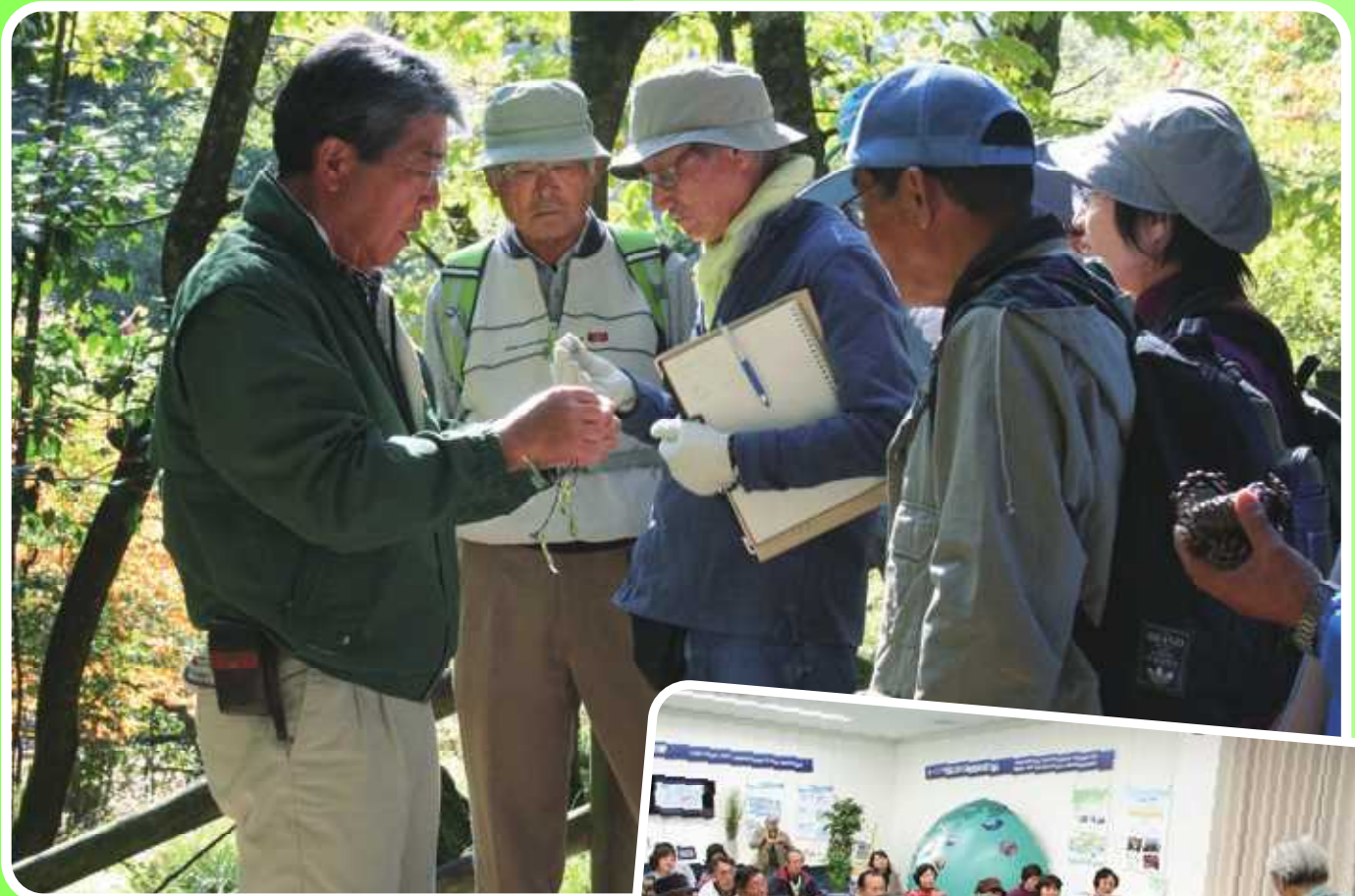
自然豊かな中播磨部会の活動風景