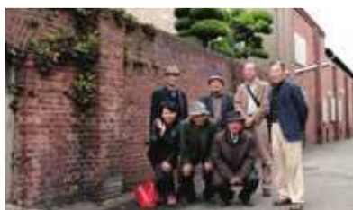
▲飾磨津物揚場跡にて