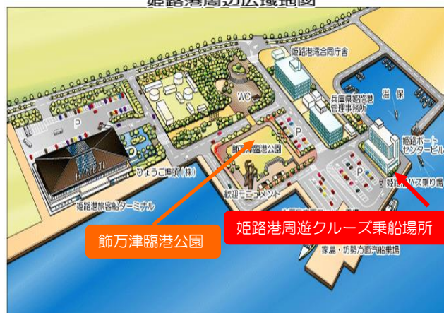
姫路港(飾磨港区)周辺図