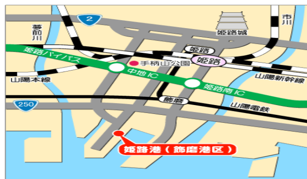
姫路港周辺広域地図