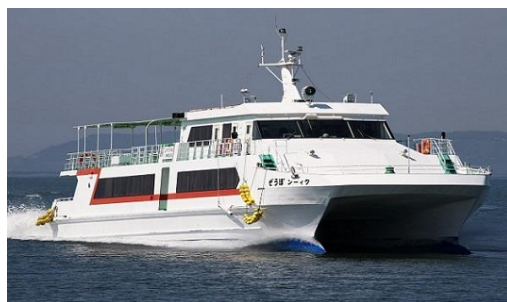
「クィーンほうせ」(総トン数173トン)