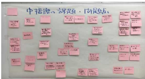
〈中播磨の課題・問題点〉