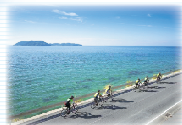
南淡路水仙ラインと沼島