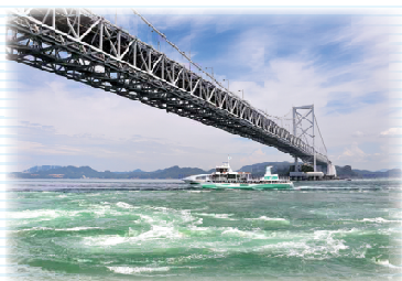
大鳴門橋と鳴門海峡の渦潮

延長 : 150km 最大標高差 : 156m 獲得標高 : 1,144m 所要時間 : 約10時間