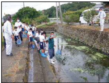
ため池や水路で生き物を捕獲 (榎列小学校)