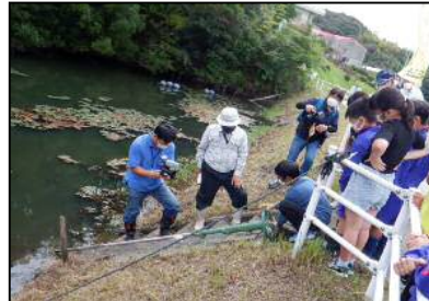
取水施設の操作体験 (中川原小学校)