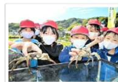
ため池に生息するモクスガニを観察する児童たち。淡路市下町、横田池

ため池の役割や生息する生き物について学ぶ「ため池教室」が6日、兵庫県淡路市立塩田小学校であった。3、4年生計約20人が、学校近くのため池にすむカニや魚を観察し、稲作の仕組みなどについて理解を深めた。