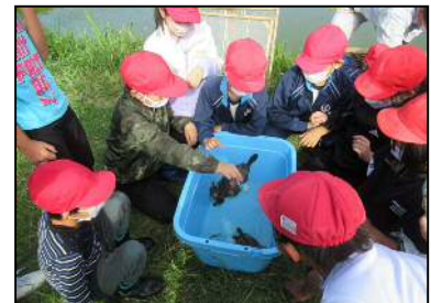
捕獲した生き物に触れ観察 (塩田小学校)