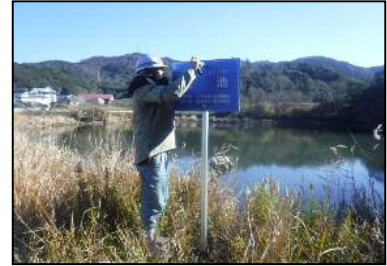
池名看板設置作業